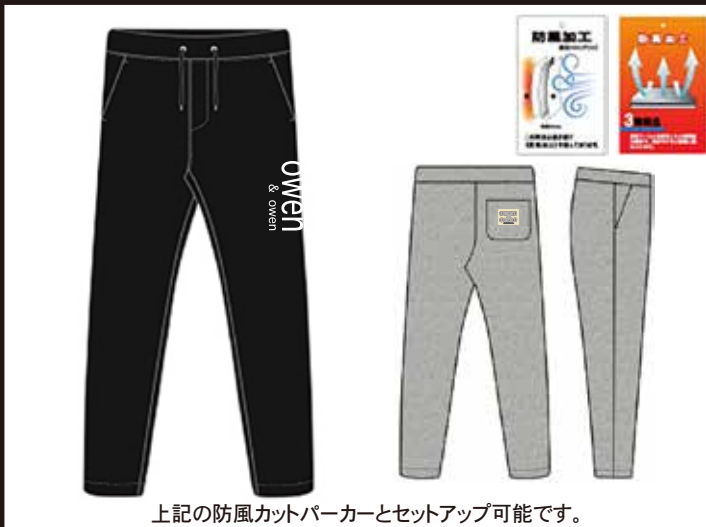
上記の防風カットパーカーとセットアップ可能です。