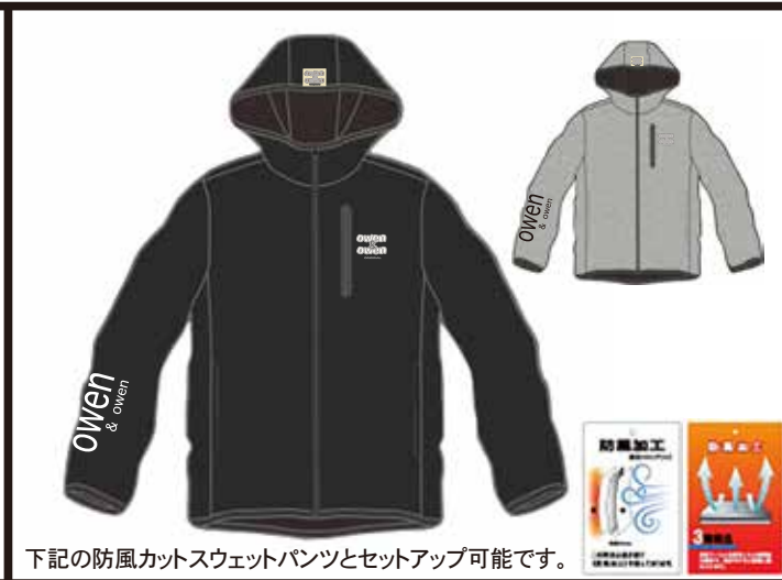
下記の防風カットスウェットパンツとセットアップ可能です。