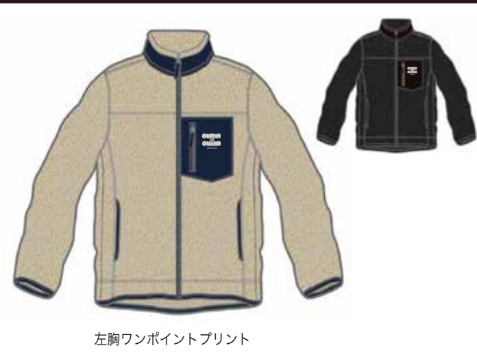
左胸ワンポイントプリント