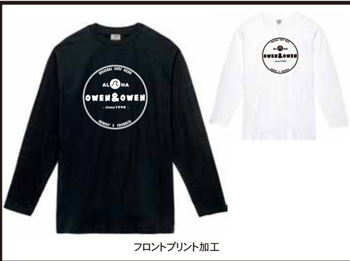
フロントプリント加工