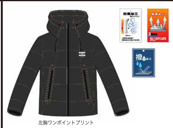
左胸ワンポイントプリント